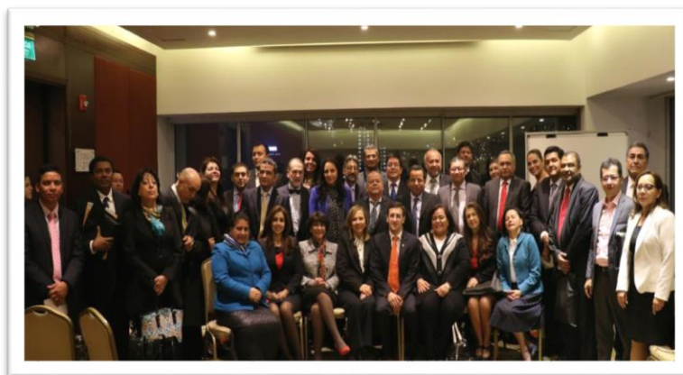
Bogotá, diciembre 1 de 2016

En cada seminario desarrollado se presentaron ponencias de los jueces, magistrados y consejeros de Estado sobre temas recurrentes en las condenas a instituciones estatales, con el propósito de prevenir el daño antijurídico, llamar la atención a las autoridades públicas y promover la eficacia y eficiencia de las normas en el Estado de Derecho en todo el país. La asistencia promedio fue de 250 personas por evento, con excepciones que llegaron hasta 1.200 participantes.